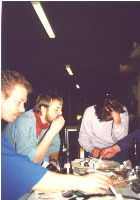
Desperationen er ved at indfinde sig ...