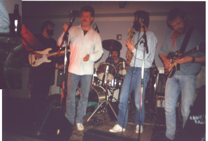
Her spilles til bal på Hotellet i Hvalsø !