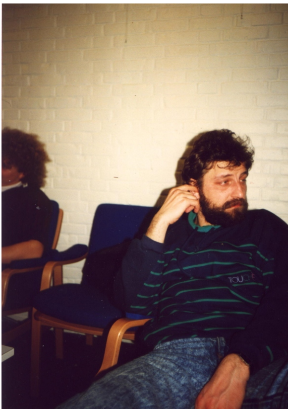
Hva' fa'en laver jeg egentlig her ??