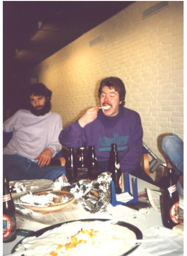
Ja, og "rigsvåbnet" var engang sort .....