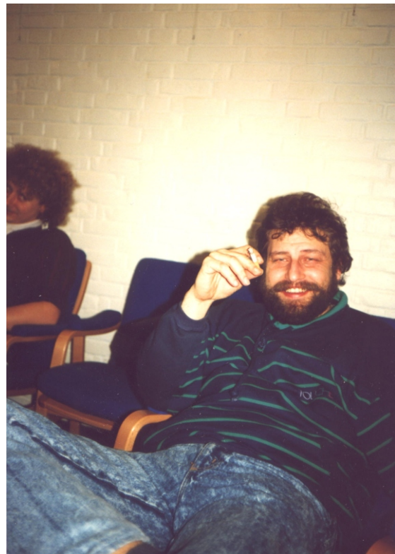
Nå er jeg på ?!