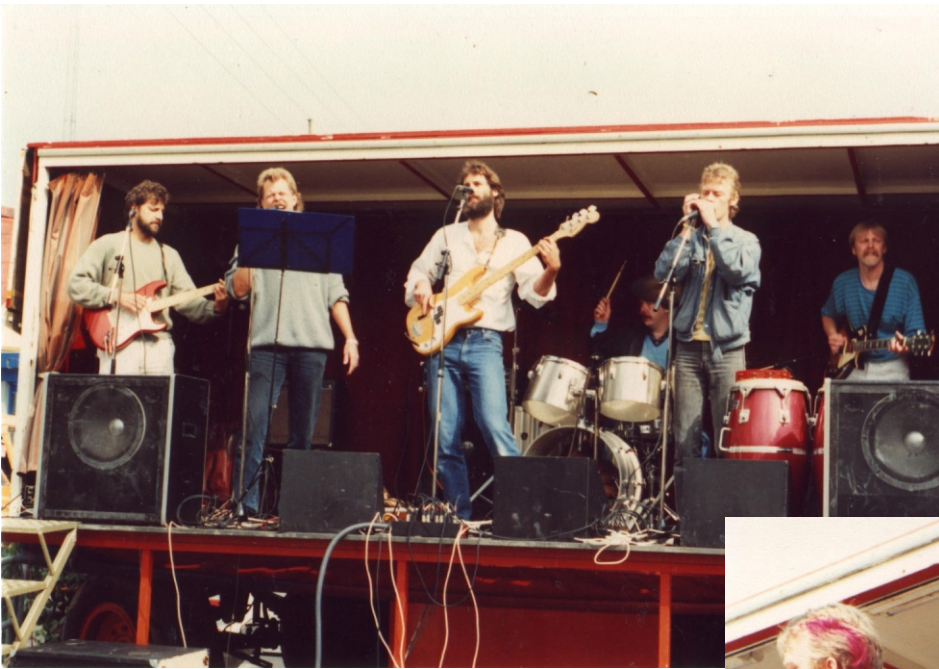
En "Street-gig" på hovedgaden i Hvalsø, Kulturkaravanens Pinsekarneval !